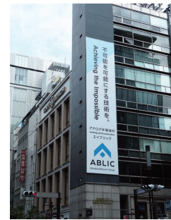
도쿄 긴자의 배너 광고

ABLE과IC (집적회로)가 합쳐 탄생된 이름인 ABLIC의 브랜딩은 반도체 기술이 가능성을 가능토록 하고, 그것이 다양한 운영면에서 회사