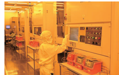
차바 현 소재 Takatsuka Unit-내 클린룸(Clean room)

에이블릭은 연간 운용수익이 대략 3층으로 증폭될 수 있게 관리하였으며, 그 현금전환주기(CCC)는 지난 4년간 크게 향상된 것을 확인할 수 있습니다. 이것은 거대 글로벌 반도체기업과 맞먹는 성공수준입니다.