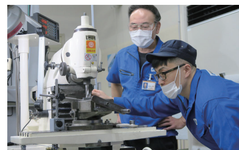
모노즈쿠리 장인정신, 세대를 넘어서 변화