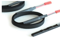
CLEAN-Boost의 배터리 미장착 누수센서

"둘째, 저희는 또한 신제품 출시를 위한 전략과 체크포인트를 절충하고, 저희의 핵심 경쟁력을 다시 증폭시키, 시키기 위해 고객의 요구사항을 공정에 반영시키는 일곱 가지 기준을 강화하였습니다. 그 중 하나는 'Rising Dragon'과 '수평적인 개발'이라 부르는 것이었습니다. 이것은 투자와 관리 자원을 우리 산