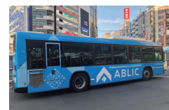
도쿄에서 운영되는 ABLIC 버스

웠습니다. 그는 제가 미국 GE 플라 스틱 본사의 Center of Excellence에서 근무하는 동안, 그는 제게 두려움, 걱정, 망설임을 버리고, '충분히 미칠 것'을 가르쳐 주었습니다. 그저 목표에 집중하고, 열정을 향해 나아가라는 것이죠."